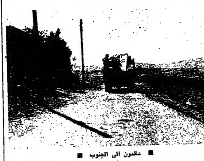
عقارون الى الجنوب

انطلاقا من صيدا باتجاه صور ومنها الى منطقة بير السلاسل، الطريق كانت كلها سالكة، ولم يعد هناك أية مظاهر مسلحة تعرض للمارين. ومن بير السلاسل انطلقا عبر طريق حديثة لم يسع الجند الجنوبيون انظار الفرج وعودوا الدولة لتميزها بظهورهم بسواعدهم وأموالهم بالعام لشقا. وتصل هذه الطريق منطقة بير السلاسل بقرى وحولا في الخطوط الامامية عبر مسافة 12 او 15 كيلومترا.